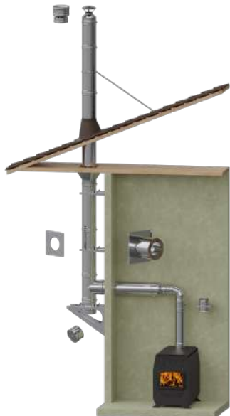
Для котла/печи вдоль наружной стены