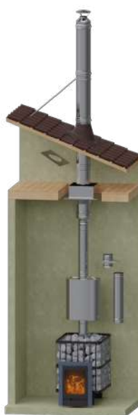
Для печи внутри помещения